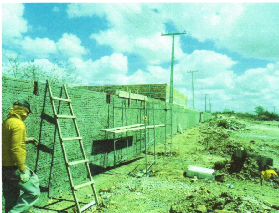
Foto 03 – MASSA ÚNICA, PARA RECEBIMENTO DE PINTURA, EM ARGAMASSA TRAÇO 1:2:8, PREPARO MANUAL, APLICADA MANUALMENTE EM FACES INTERNAS DE PAREDES, ESPESSURA DE 10MM, COM EXECUÇÃO DE TALISCAS