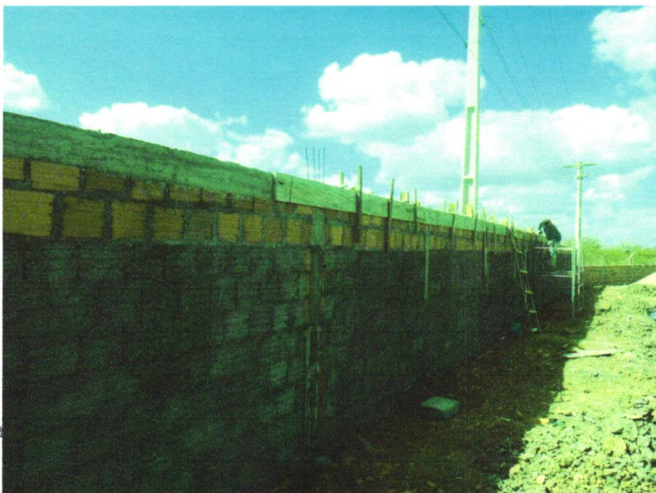
Foto 06 - (COMPOSIÇÃO REPRESENTATIVA) EXECUÇÃO DE ESTRUTURAS DE CONCRETO ARMADO, PARA EDIFICAÇÃO INSTITUCIONAL TERREA, FCK = 25 MPA. AF_01/2017