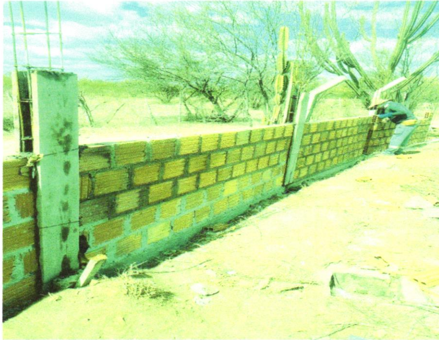
Foto 01 - ALVENARIA DE VEDAÇÃO DE BLOCOS CERÂMICOS FURADOS NA VERTICAL DE 9X19X39 CM (ESPESSURA 9 CM) E ARGAMASSA DE ASSENTAMENTO COM PREPARO EM BETONEIRA. AF_12/2021