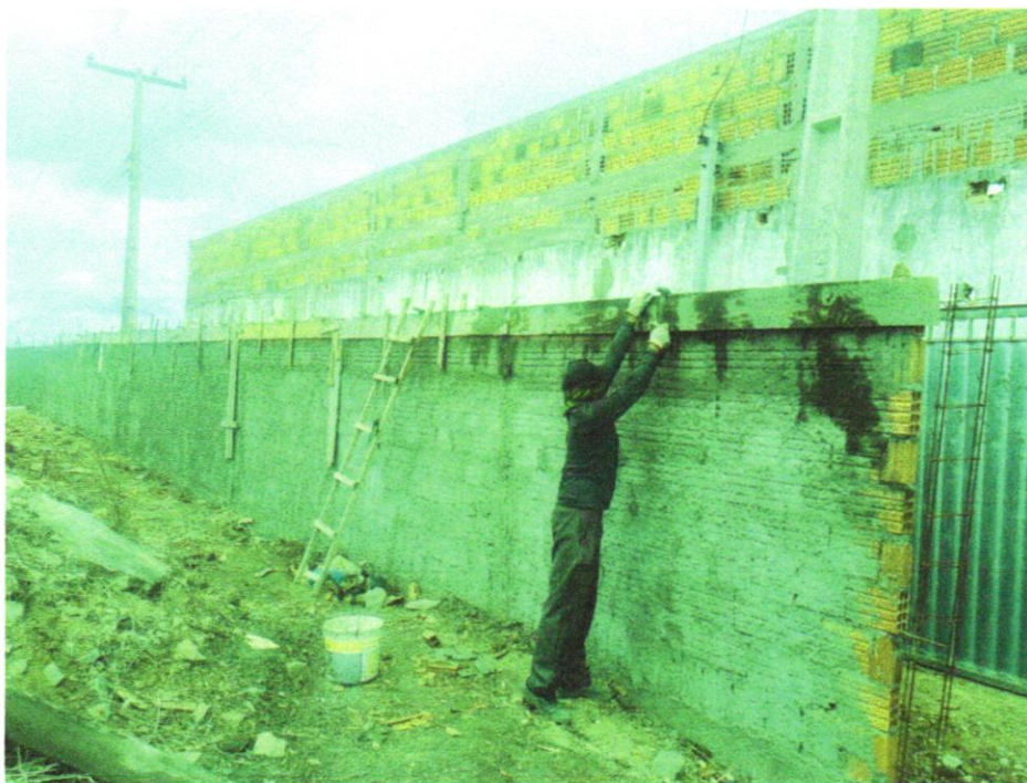
Foto 05 - (COMPOSIÇÃO REPRESENTATIVA) EXECUÇÃO DE ESTRUTURAS DE CONCRETO ARMADO, PARA EDIFICAÇÃO INSTITUCIONAL TERREA, FCK = 25 MPA. AF_01/2017